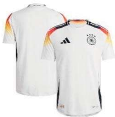
Trikot der Deutschen Fußball-Nationalmannschaft

Vier Marken und ein Design, 25) so viel IP steckt im aktuellen Trikot der Deutschen Fußball-Nationalmannschaft des Sportartikelherstellers adidas . Dies umfasst drei Marken und ein Design von adidas selbst, nämlich (i) das Logo mit den drei Streifen als Bildmarke auf der einen Brusthälfte 26) , (ii) die eingenähten drei Streifen auf den Schultern als Bild-/Positionsmarke 27) , (iii) eine Marke zum Schutz des von adidas hergestellten und für das Trikot verwendeten Stoffes „HEAT.RDY“ 28) und (iv) die Erscheinungsform des Trikots als Design. 29) Auf der anderen Brusthälfte befindet sich das Wappen des Deutschen Fußball-Bundes (DFB), das als Wortbildmarke 30) geschützt ist.