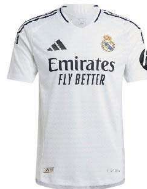
Trikot von Real Madrid

Sponsoren auf den Trikots der nationalen Klubs. Sind es in den meisten Ländern ein bis zwei Sponsoren, die das Trikot der Fußballklubs zieren, so hat sich die Praxis in Österreich ganz nach dem Motto „Umso mehr, umso besser!“ entwickelt. Das in diesem Zusammenhang wohl bekannteste Trikot im österr Klubfußball ist das des TSV Hartberg . Über das gesamte Trikot verteilt befinden sich in der aktuellen Saison insgesamt 17 Sponsoren 33) , die selbstverständlich alle von wesentlichem wirtschaftlichen Wert für den Klub sind. Der Produktausstattungschutz durch Marken und Designs ist somit auch aus vermarktungstechnischer Sicht von immenser Bedeutung.